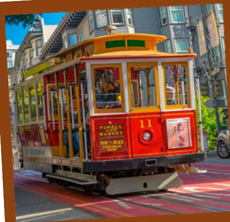
Agence de voyage Le Monde en Direct