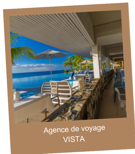
Agence de voyage VISTA

Tarif à partir de / adulte en chambre double supérieure