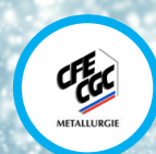
Secrétaire Adjoint Commission des Marchés