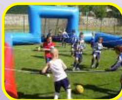
Baby foot Humain