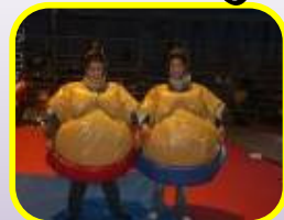
Combat de sumos