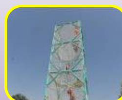
Tour de grimpe