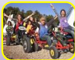
Kart à pédales

Dans l'intérêt des enfants et selon conditions climatiques, le programme est susceptible de modifications.